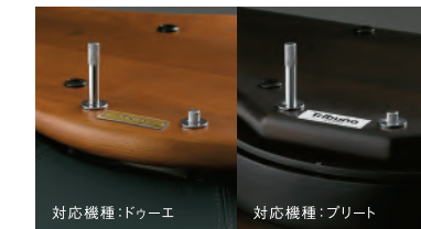
対応機種：ドゥーエ

回転軸の中心部分にシリアルナンバーがついていま す。プレート又はシールが埋め込まれています(機種 によって異なります)。このシリアルナンバーにより、購 入チェアの製造年月日、製品仕様などが管理され、 修理が必要になった場合などは、データベースで製 品情報をスムーズに確認することができて安心です。