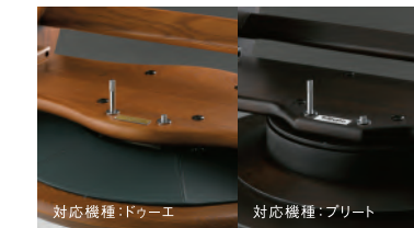
対応機種：ドゥーエ

オットマンから足を下ろし両足を床につけた状態で 座ったまま本体を回せば、360度の回転が可能です。 またトリブナでは、ご使用に合わせ専用のストッ パー棒を差し込めば回転を止めることができます。 (詳しくは取扱説明書をご確認ください。) ※一部商品を除く