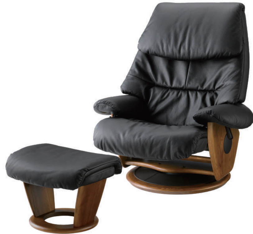
(写真は革色:ブラック × 木部色:ライトブラウン × 座面高:LOWタイプ)