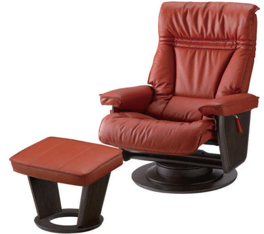
(写真は革色:テラコッタ × 木部色:ダークブラウン × 座面高:LOWタイプ)